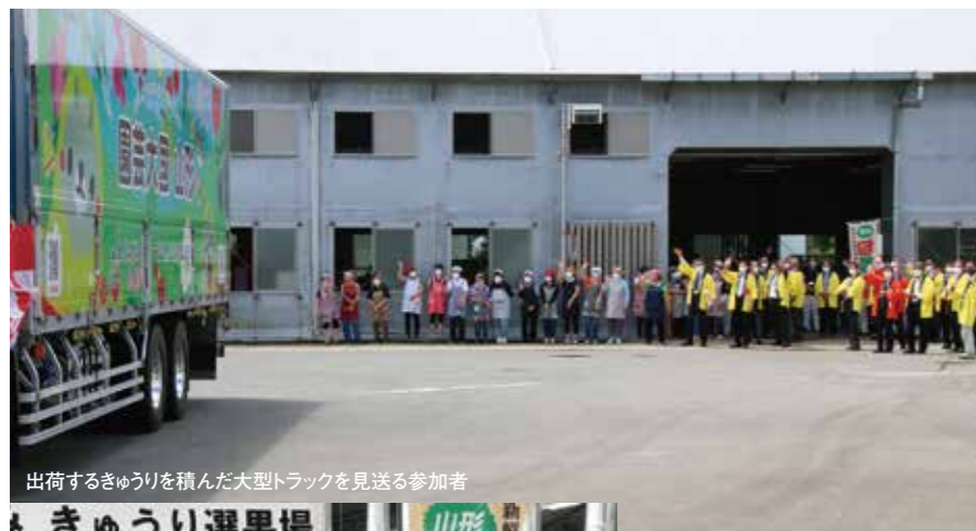
出荷するきゅうりを積んだ大型トラックを見送る参加者