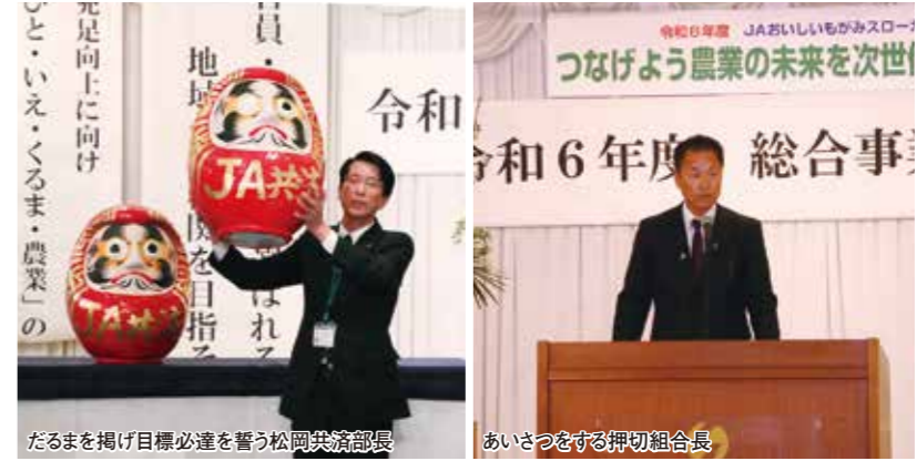
あいさつをする押切組合長