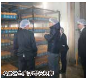
なめこ生産現場を視察

4月19日、東京青果の販売担当者と青果バイヤーの（株）トライアルストアーズがJAを訪れ、情報交換と施設視察を行いました。 鮭川営農センター管内の（農）オークファームで、なめこの生産現場を視察しました。東京青果の販売担当者は「消費者には、生産者と産地の背景が伝わるような販売を行っている」と話していました。