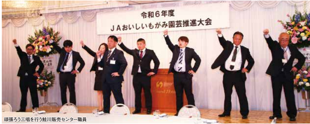
頑張ろう三唱を行う鮭川販売センター職員