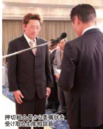
押切組合長から委嘱状を受け取る生産相談員