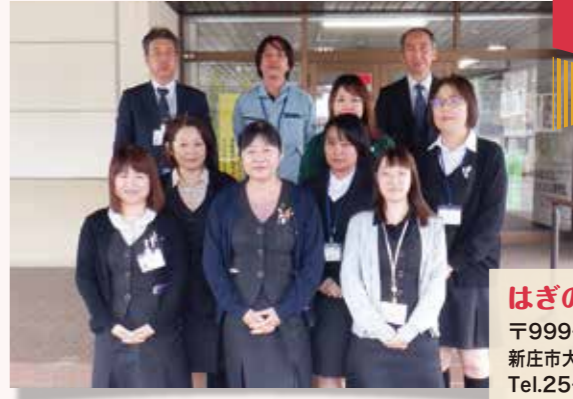
はぎの支店 〒999-5103 新庄市大字泉田字泉田2 Tel.25-2211