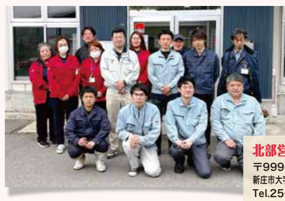
北部営農センター 〒999-5103 新庄市大字泉田字往還東151 Tel.25-3611